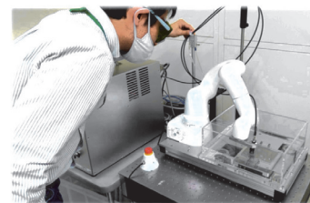
開発したレーザーピーニング装置