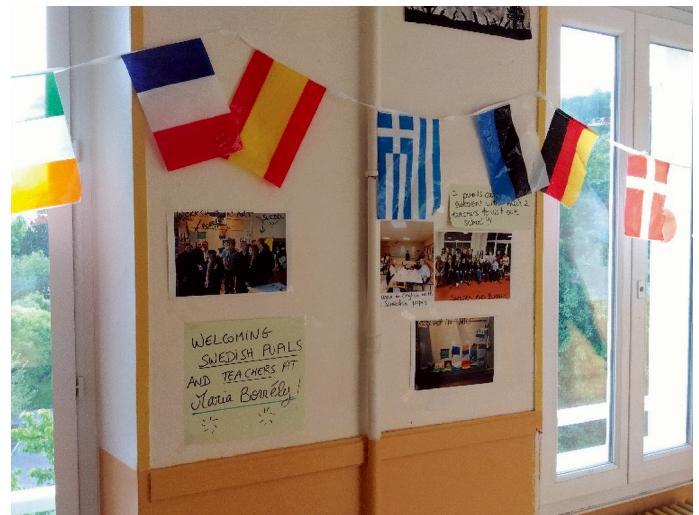
EUのプログラムを通じた国際交流（フランスの中学校）

本研究は、学校教育をめぐる差別、障害、格差の実態やその撤廃、縮小、是正に向けた取り組みについて、当事者性を基調とした、現場で得たデータを駆使して、教育の包摂や普遍化へ向けた実態に迫るところに特徴があります。国内外の教育政策や制度改革において、グローバルに考えながら、ローカルな課題に答えようとするものです。マイノリティ文化への理解と共に、共生社会の実現の礎となる学校教育の政策や制度の実現を目指しましょう。