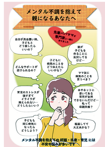
補足図表 精神疾患を治療中の人が妊娠した時に渡すパンフレット