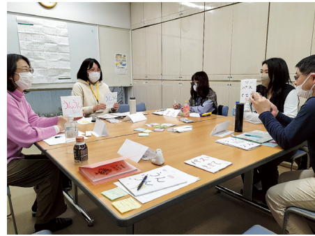
写真1. 「あいりき」の実施場面