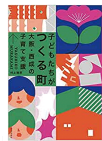
『子どもたちがつくる町 大阪・西成の子育て支援』 （世界思想社、2021）