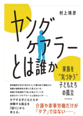
『「ヤングケアラー」とは誰か 家族を“気づかう”子どもたちの孤立』 （朝日選書、2022）