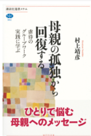
『母親の孤独から回復する』 （講談社、2017）