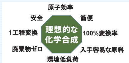
図2. 環境にやさしい化学合成法 (Clark, J. H. Green Chem. 1999を一部改変)